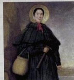
Mary Anning, som levde i England på 1800-talet, samlade på fossil som hon sedan sålde.